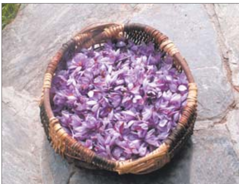
Le safran de Mund, une des AOC à l'honneur à Brigue.

Brigue offrira donc une palette assez vaste pour faire connaître les fleurons de l'agriculture valaisanne. Ses produits phares serviront d'ambassadeurs à d'autres peut-être moins célèbres auprès de la clientèle suisse.