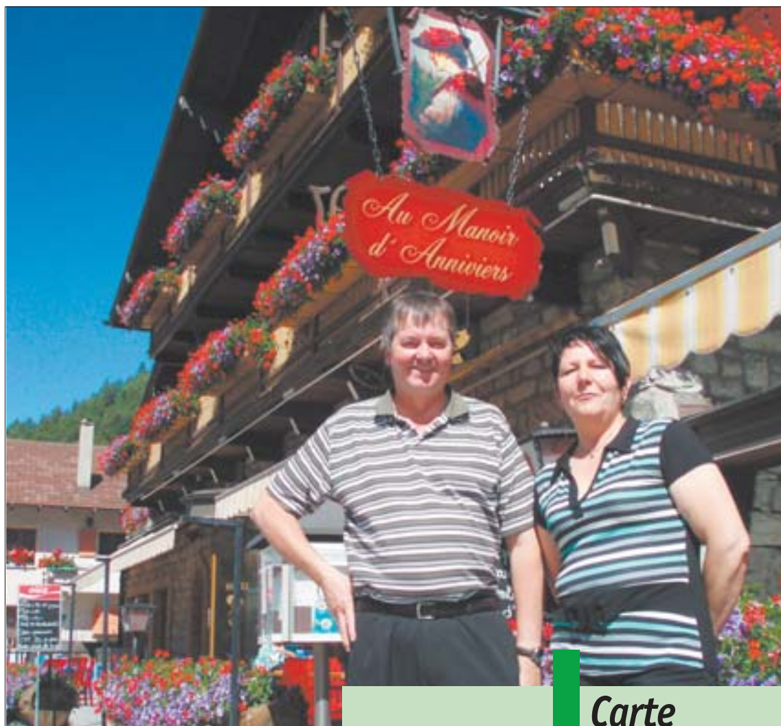
Le Manoir d'Anniviers, étape gourmande au cœur de la vallée.

Si le Manoir d'Anniviers a l'honneur de figurer au célèbre «Guide Mi-