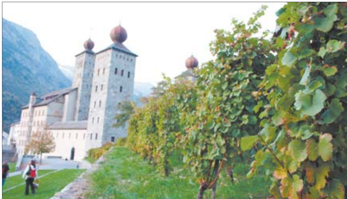
Les Festival des AOC se déroulera dans le cadre magnifique du château Stockalper de Brigue.

Concernant les animations, une vingtaine de chorales de tous les pays d'Europe chanteront dans le cadre magnifique de la cour du château Stockalper, réputée pour son acoustique. Les orga-