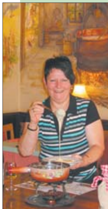
La fondue au muscat, fierté de l'établissement.

Pour célébrer un événement particulier, une descente à la cave est envisageable pour un apéro valaisan et la découverte des crus du patron.