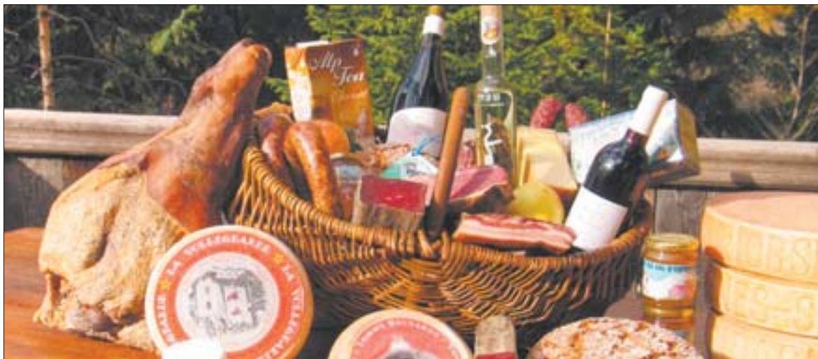
La Corbeille d'Entremont est richement garnie!

Représentative des divers produits de la vallée, la Corbeille d'Entremont suggère divers assortiments d'une valeur moyenne de 80 francs, qui peuvent être commandés sur le net, réservés par téléphone ou retirés auprès des commerces référencés. Avec le soutien du site, l'association a vendu l'année dernière 2300 corbeilles générant un chiffre d'affaires proche des 200 000 francs! Evidemment, l'impact de l'internet ne se limite pas à la commercialisation des corbeilles et les surfeurs sont prioritairement invités à contacter et rencontrer les producteurs et les commerçants, ce qui génère des retombées d'autant plus appréciables pour l'agriculture de la région.